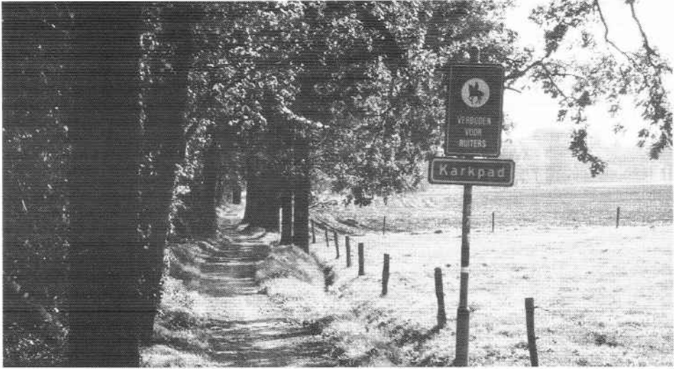
Kerkpad vanaf Jonkersweg naar Ravenhorstweg Foto 16 10 2000

Vergeet toch niet, bij al de sport, Die onze tijden vormen, Dat 't beste vaak vergeten wordt: 't Geen sterkt in 's levens stormen. O, Kerkweg, eer van Meddoo's buurt, Blijf eind'loos ons verhalen, Van wat op u al is gebeurd. Dat wij van 't goe niet dwalen.