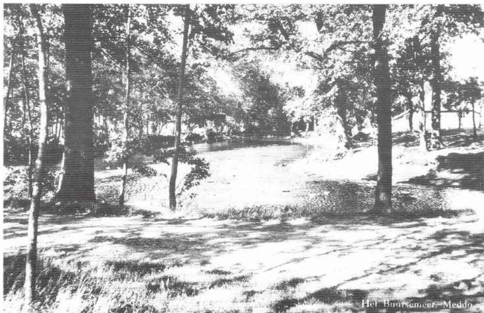
Het Buursermeer, Meddo