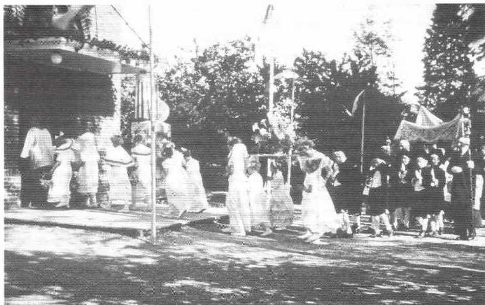
Processie Meddo 1954