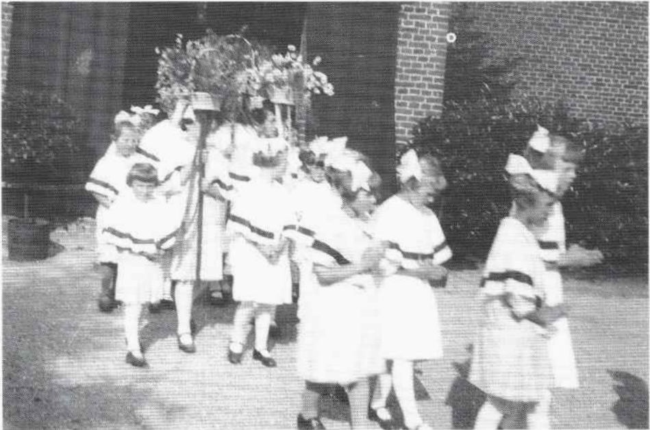
Meddose bruidjes dragen bloemenmanden tijdens de processie. Foto ca 1934

Een eigen St. Jansfeest zat er aanvankelijk niet in. In 1890 richtte Pastoor Prenger een verzoek aan de bisschop om voortaan niet meer samen met Winterswijk het feest van de heilige Jacobus (25 juli) te hoeven vieren, maar als zelfstandige parochie in plaats daarvan het feest van de eigen patroon, St. Jan, op 24 juni. De bisschop weigerde dat toe te staan. Het archief vermeldt dat Pastoor Prenger zich daardoor niet uit het veld liet slaan en op die dag een plechtige dienst heeft geleid. In 1928 is er voor het eerst een Sacramentsprocessie en wel op 24 juni. (zie ook Meddo * pg. 84)