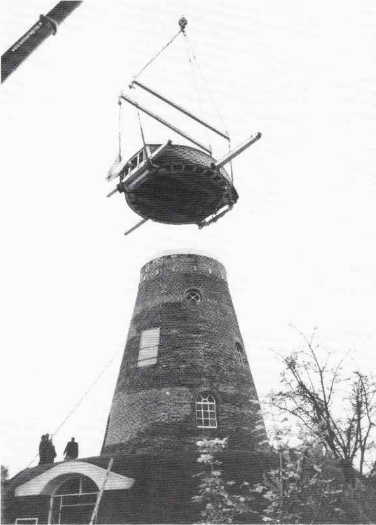
Plaatsing van de molenkap op de molenromp op 30 09 2000